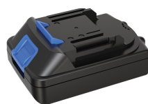
BATTERIA RICARICABILE AL LITIO 5120071