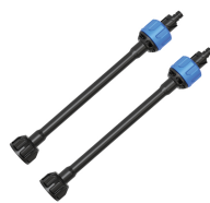
DOPPIA PROLUNGA LANCIA 5120011