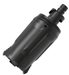
TESTINA 4IN1 5120040

Sfoggia tutti gli accessori già presenti nella confezione e progettati per implementare le funzionalità di ogni macchina.