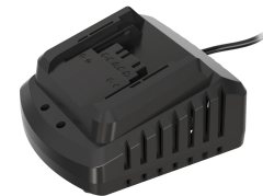
CARICA BATTERIA RAPIDO 5120190