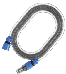
KIT AUTOADESCAMENTO 5120051